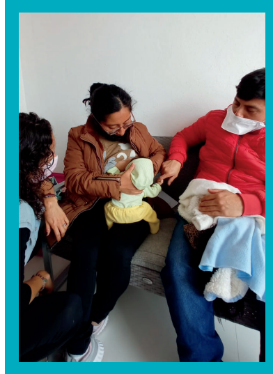
Asesoría en lactancia