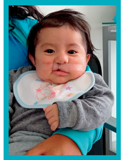
4 meses de edad